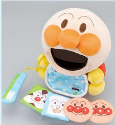
（写真1）ぱくぱくアンパンマン

子ども用の歯みがき剤にはたくさんの種類や味があります。色んな味にチャレンジして好みの味を探し少しづつ慣れましょう。歯みがき剤ディスペンサー（写真2）は自動で歯みがき剤が出ます。歯みがき剤を付けるのを嫌がるお子さんにも、ちょっとした動機づけになります。