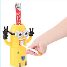
（写真2）歯みがきディスペンサー