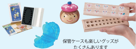
保管ケースも楽しいグッズがたくさんあります

抜けたばかりの乳歯は血がついていたりタンパク質がついていることがありますが、一晩オキシドールにつけておきましょう。その後、歯ブラシや綿棒などを使用して汚れを洗い流しキッチンペーパーやコットンの上で十分に乾燥させてからケース等に保管しましょう。